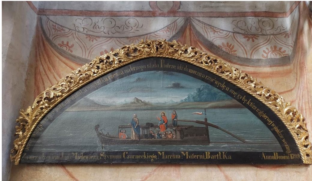
5. Obraz Kazanie na łodzi, Kaplica św. Barbary w kościele Katedralnym pw. św. Jana Ewangelisty i św. Jana Chrzciciela w Toruniu.

Kolejna inspiracja do tej sceny to kamienna tablica cechu tragarzy z fasady kamienicy przy ulicy Ducha Świętego nr.1 w Toruniu