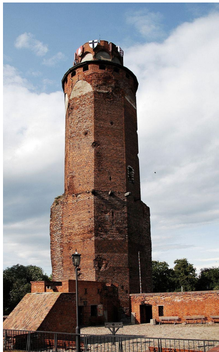
3. Wieża zamku Krzyżackiego w Brodnicy