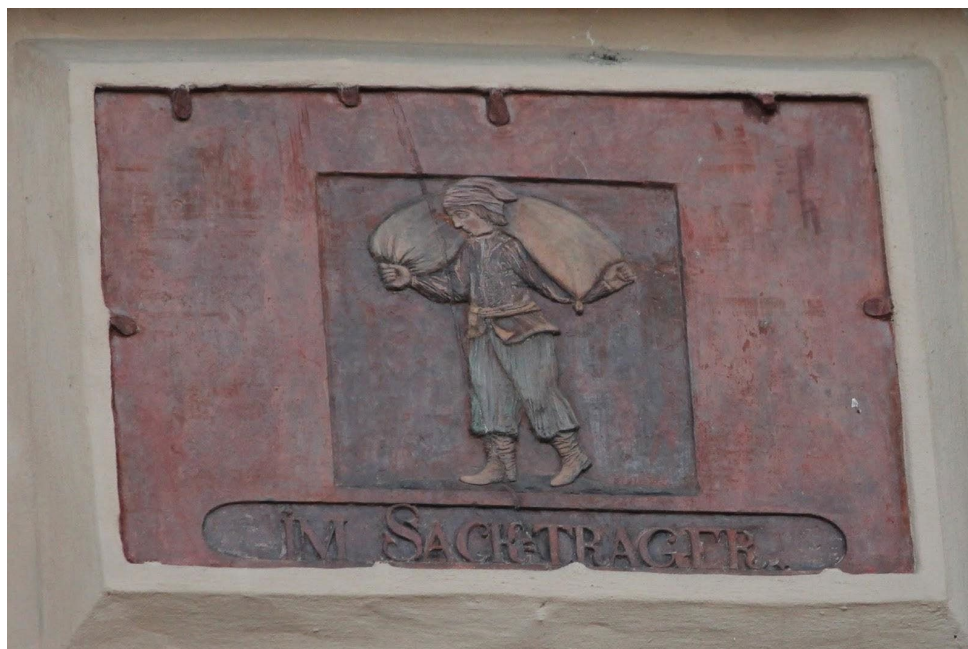
6. Tablica cechu Tragarzy fasada Kamienicy przy ulicy Ducha Świętego 2 w Toruniu, fot. Paweł Kociński.

Kolejna inspiracja do tej sceny to kamienna tablica cechu tragarzy z fasady kamienicy przy ulicy Ducha Świętego nr.1 w Toruniu