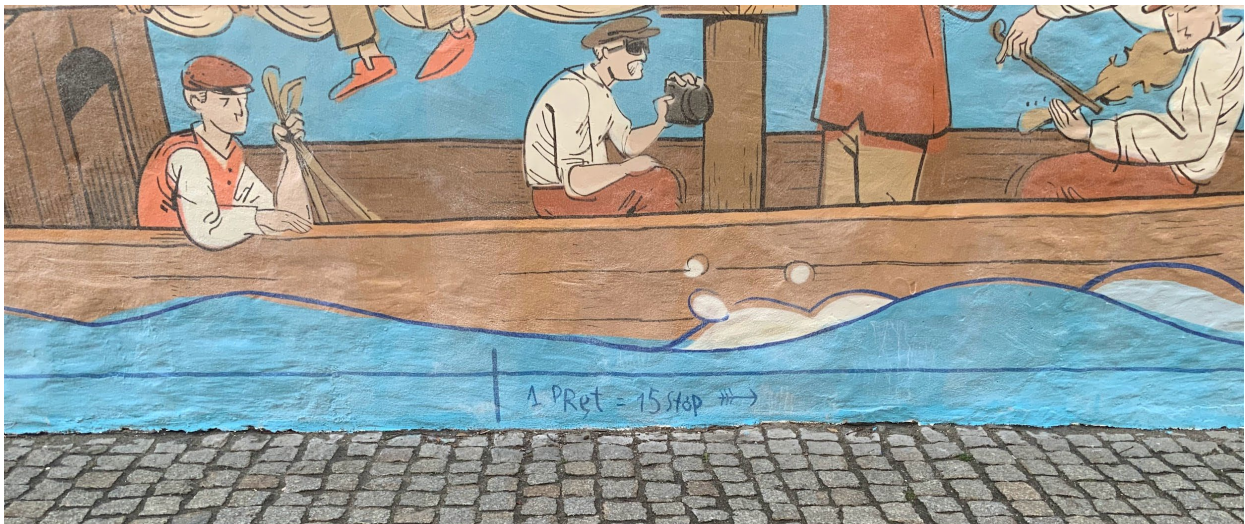
Miara pręta chełmińskiego umieszczona na muralu.

Zadanie dla uczestników będzie polegało na odtworzeniu tej sytuacji. Celem będzie trafienie jak najbliżej określonego punktu, który znajduje się kilka metrów na prawo od szwedzkich armat widocznych na muralu. Cel może być oznaczony np. jako kretowisko lub humorystycznie przedstawiony flisak śpiący na trawie, co wprowadzi dodatkowy element zabawy i nawiązuje do lokalnych tradycji. Na prawo i lewo od celu znajduje się podziałka z odległościami odpowiadającymi dawnym miarom, które były stosowane w Toruniu, tzw. miarom chełmińskim. Warto przypomnieć, że to według tych miar zostało rozplanowane całe miasto, co łączy się tematycznie z pierwszą sceną muralu przedstawiającą założenie Torunia.