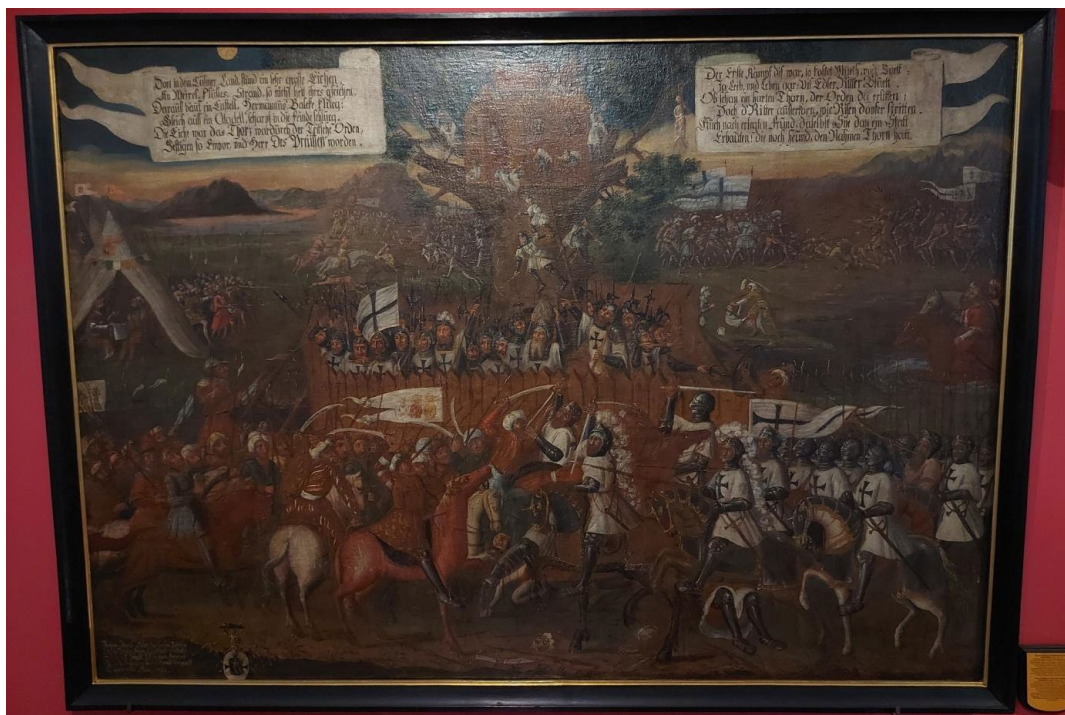
1. Obraz Przybycie Krzyżaków na Ziemię Chełmińską, olej płótno 1713 r., eksponowany w Ratuszu Staromiejskim, fot. Paweł Kociński.

Pierwsza scena muralu, przedstawiająca Prusów oblegających krzyżacką warownię na prastarym dębie, stanowi symboliczną wizualizację nie tylko początków krzyżackiego podboju ziem pruskich, ale także genezy miasta. To właśnie w tym miejscu, nad brzegiem Wisły, powstał jeden z kluczowych ośrodków krzyżackiej administracji i handlu, który wkrótce stał się jednym z największych i najbogatszych średniowiecznych miast Europy Wschodniej.