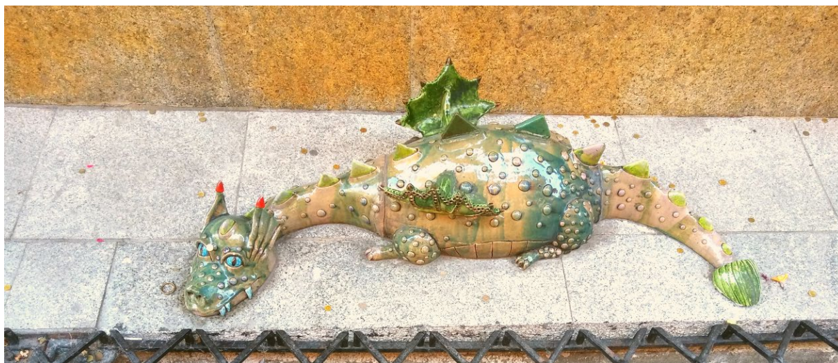
12. Pomnik Smoka w miejscu w którym miał być widziany 13 sierpnia 1746 roku, fot. Paweł Kociński.