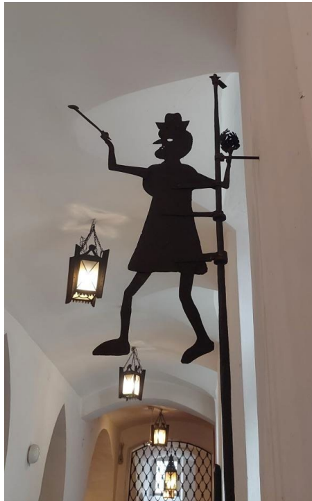
2. Podobizna kucharza z bramy Chełmińskiej, Muzeum Okręgowe w Toruniu, Ratusz Staromiejski, fot. Paweł Kociński.