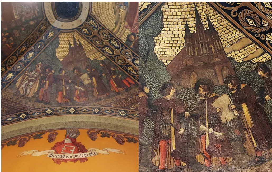
8. Polichromie z sieni Dworu Artusa w Toruniu, fot. Paweł Kociński.

Ukrytym elementem jest także flisak w okularach typu RayBan. Do stworzenia tego elementu zainspirował nas żart jednego z konserwatorów Dworu Artusa w Toruniu, który podczas renowacji malowideł w sieni tego budynku domalował tego typu okulary jednej z postaci w orszaku mieszczan.