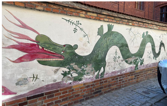
11. Smok z starego muralu autorstwa Iwony Liengmann na ul. Przedzamcze 11/15 w Toruniu, fot. Paweł Kociński.

Dzięki temu muralowi, Toruń nie tylko ożywi swoją dawną legendę, ale także wzbogaci przestrzeń miejską o kolejne dzieło sztuki, które zachęci do refleksji nad historią i mitycznymi opowieściami, które wciąż żyją w pamięci miasta.